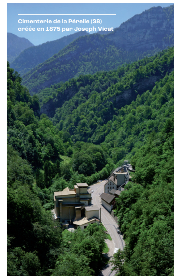
Cimenterie de la Pérelle (38) créée en 1875 par Joseph Vicat

Contrairement à la chaux hydraulique, la pierre, contenant très peu de chaux vive, ne subit pas d'extinction après la cuisson. C'est cette particularité qui lui donne le nom de ciment naturel et non de chaux hydraulique naturelle.